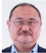
浜村 弘一氏 (日本eスポーツ連合副会長)